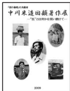
展示会記念誌を 発行しました